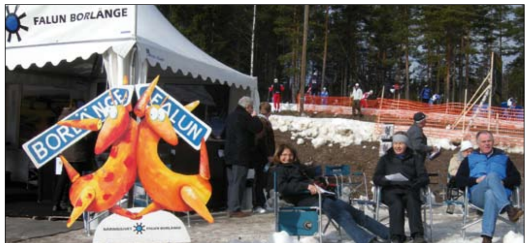
Ibland tittade solen fram under SM-dagarna. Här är det några skidentusiaster som njuter utanför NFB-tältet.