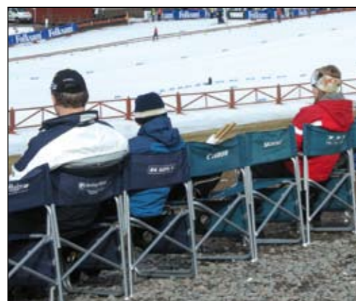
Några av medlemsföretagen sponsrade registreringsstolar inför Skid-SM och Runndagarna, något som publiken uppskattade i samband med tävlingarna.