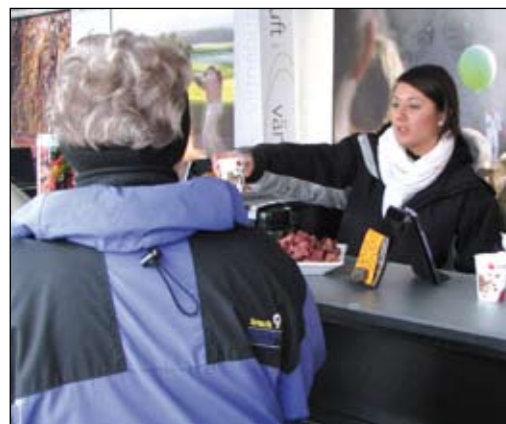
Full fart i NFB:s och Högskolan Dalarnas tält där högskolestudenterna bjöd på kaffe, kolv och godis.